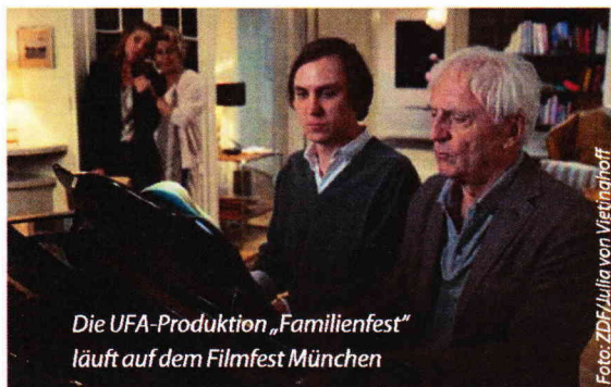
Die UFA-Produktion „Familienfest“ läuft auf dem Filmfest München

im Feuer. Übertroffen werden TV60, Bavaria und die ZDF-Tochter noch von der UFA Fiction, die ihren Stellenwert mit gleich vier Produktionen im Wettbewerb unterstreicht. Zudem darf man sich auf einige Filme freuen, die bereits während ihrer Entstehung viel Aufmerksamkeit auf sich zogen, wie Murnbergers „Luis Trenker – Der schmale Grat der Wahrheit“ oder Kraumes Tabula-rasa-Geschichte „Familienfest“ – eine der vier UFA-Produktionen. Mit Fromms Amokläufer-Psychogramm „Silvia S. – Blinde Wut“, Tragesers „Der Äthiopier“ und Harrichs Waffenhändler-Thriller „Meister des Todes“ sind aber auch Produktionen vertreten, deren Existenz bislang nur wenigen bekannt war. Die 18 Filme der Sektion konkurrieren um den von der VFF vergebenen Bernd Burgemeister Preis. Dieser wird am 28. Juni an den Produzenten des Siegerfilms verliehen. Die Teilnehmerliste ist unter: www.blickpunktfilm.de/TV_Reihe_Filmfest2015 einzusehen. fra